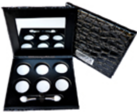
Palette vide 6 godets Paris Ax Professional €6.70