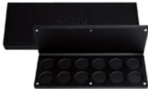
Palette vide 12 godets Paris Ax Professional €10.30