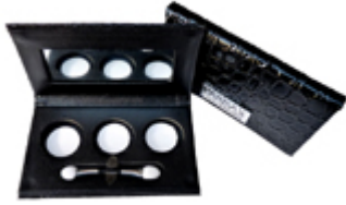
Palette croco vide 3 godets Paris Ax Professional €4.95