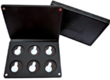
Palette vide 6 godets Paris Ax Professional €8.99