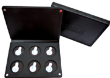
Palette vide 6 godets Paris Ax Professional €8.99