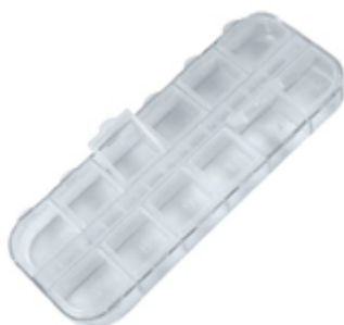
Boite vide 12 compartiments Paris Ax Professional €3.95