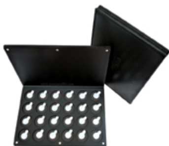
Palette vide 24 godets Paris Ax Professional €16.95