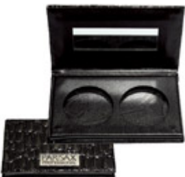
Palette croco vide blush 2 godets Paris Ax Professional €5.50